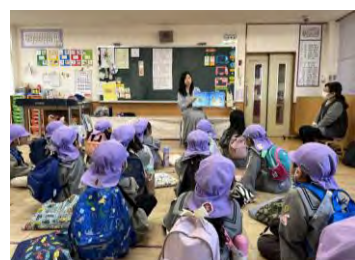
ふわふわプリンのよみきかせ