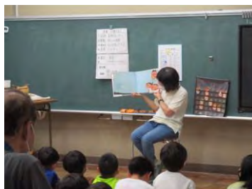
オレンジママのよみきかせ

絵本を基にした話をペープサートやパネルシアターで演じています。公演では手遊びや紙芝居等も加えて見ている人たちと楽しい時間を共有しています。