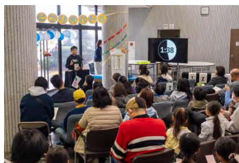
令和5年度ビブリオバトル