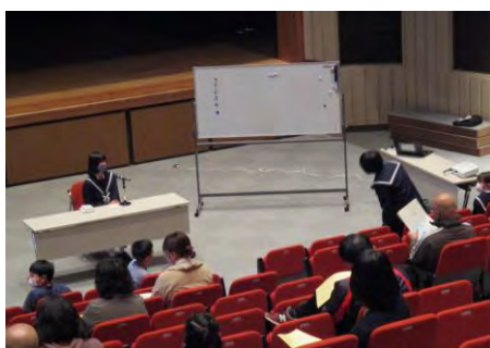
令和4年度ビブリオバトル

令和4年度から読書活動実行委員会主催のビブリオバトルを開催しています。発表者（バトラー）は小中学生、観戦者は一般の方からも募集し、令和4年度は8名、令和5年度は5名の発表者の参加がありました。どの発表者も本に対する熱い想いを堂々と発表し、観戦者に感動を与えるビブリオバトルになりました。