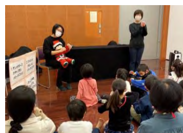
おおきなき Sakahogi の活動