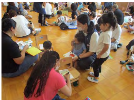
えほんゆうびんの制作