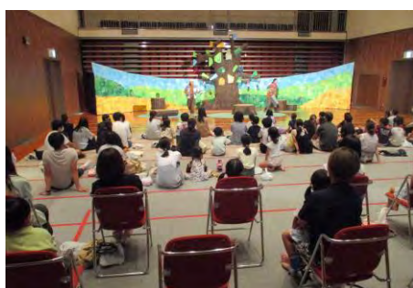
ブックフェスタでの観劇会