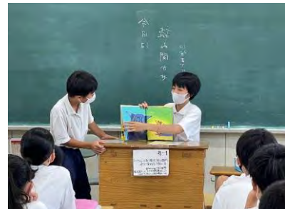
図書委員によるよみきかせ