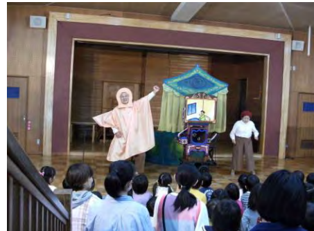
子ども読書の日の取り組みでの観劇