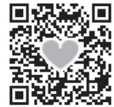
ひとり親センターホームページ