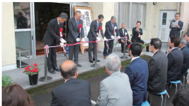
オープニングセレモニー：テープカット