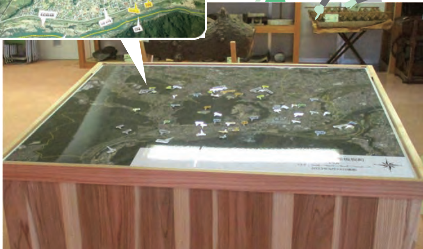
坂祝町の最新の航空写真を展示