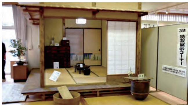
昭和30年代の居間の再現