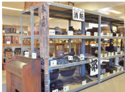
消防機材・住生活の展示（常設展）