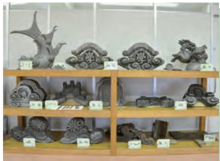
瓦産業の鬼瓦等展示（常設展）

応募方法：中央公民館・郷土資料館で応募用紙に希望の施設名を記入して提出してください。 施設名の提案は電話でも可能です。 中央公民館 ☎66-2409 皆さんの素晴らしいアイデアをお待ちしています。