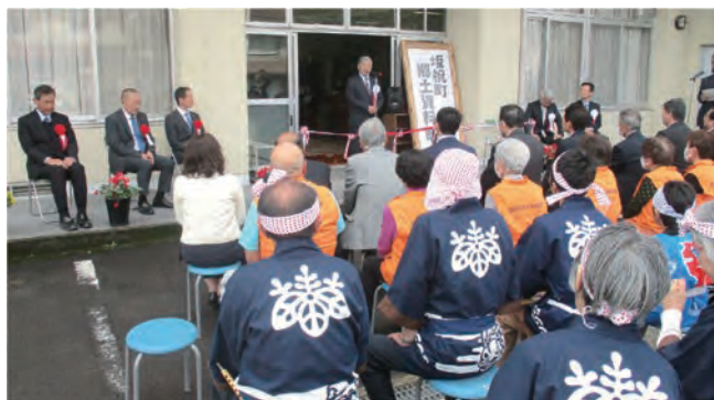
オープニングセレモニー：町長のあいさつ

また資料館の一角に昭和30年代の居間も再現しました。ちゃぶ台や座机・黒電話・火鉢に掛時計そしてラジオが置かれた空間に身を置くことで、その頃の生活を感じることができます。