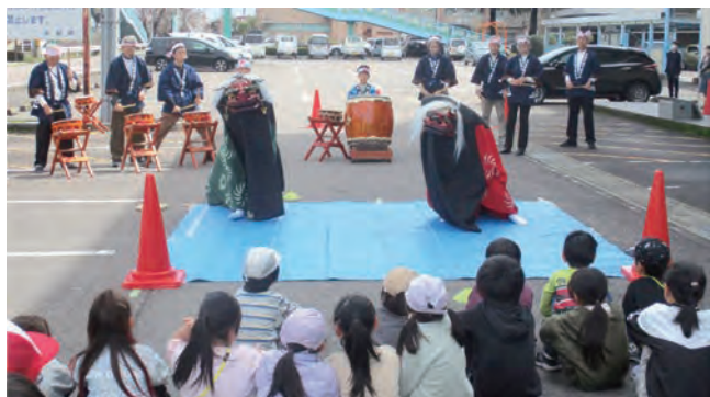
黒岩祭囃子による笛・太鼓の演奏と獅子舞