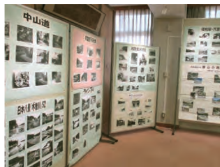
特別展示「ふるさとの写真展」

※リニューアルにあたっては、令和5年度岐阜県清流の国ぎふ推進補助金を活用しています。