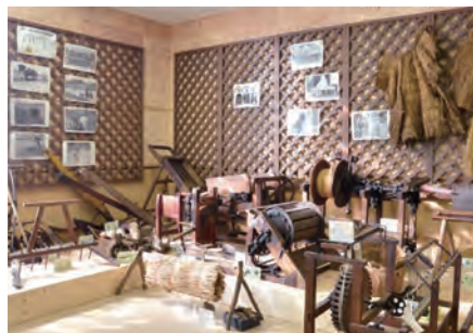
農機具の展示（常設展）