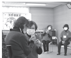
加茂山地区活動の様子