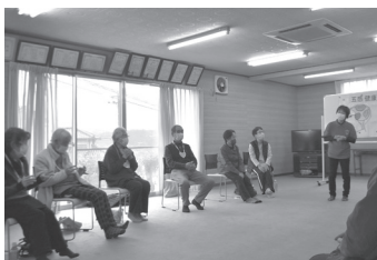
ふれあいサロンの様子

ボランティアも募集しています。興味がある方は坂祝町社会福祉協議会までお問い合わせください。