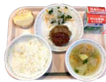
ふるさとカラーのグローバル給食

グローバルな「坂祝の味」をテーマにしたこの給食は、町で作られた5種類の野菜を使い、洋風な味付けと組み合わせにしました。「坂祝らしさ、ふるさとカラーを大切にしたい給食で、町のみんなが、寒い時期も元気に、笑顔ですごしてほしい」という思いで作られました。