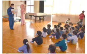
消防士とディッキーからのレクチャー