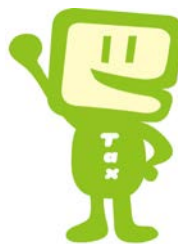
国税庁e-Taxキャラクター イータ君

※マイナンバーカードがなくても申告はできますが、マイナンバーカード方式が便利! まだ受け取っていない方はお早めに!