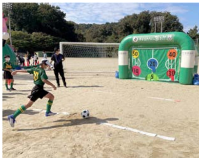
サッカー「キックターゲット」