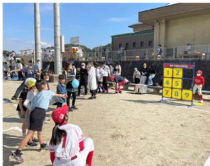
野球「ストラックアウト」