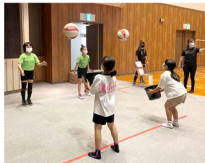
バレー 「バケツでボールキャッチ・レシーブでポイントGet」

スポーツ少年団に関する問い合わせは、教育課 ☎ 66-2409 ※体験入団できます。