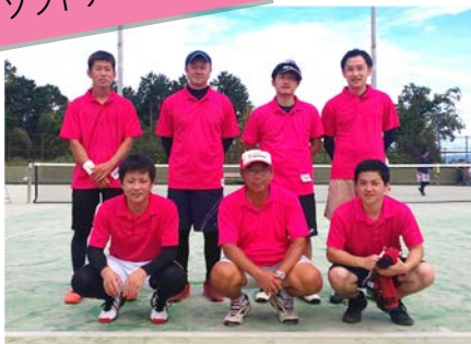
ソフトテニス(男子)