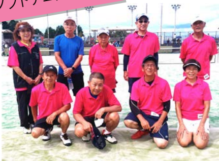
ソフトテニス(成壮年)