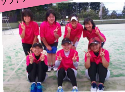
ソフトテニス(女子)