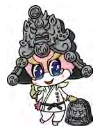
FC岐阜公式マスコットキャラクター ギフイー（坂祝町 ver）