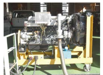
関商工高校との合作のディーゼルエンジン

地蔵院は、宗派・曹洞宗のお寺です。坂祝村誌によると、当院の前身は一仏堂であり、天正文禄時代の創開から今日まで約450年の歴史があります。 参加者は、普段見られない車の整備過程の教材に興味津々でした。 は、一般の方も利用でき、一食400円程です。