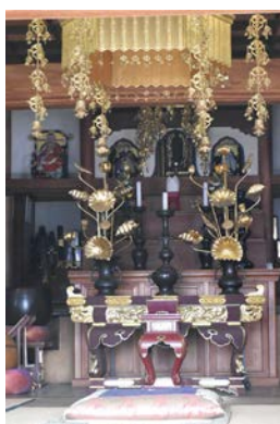
地蔵院の本堂内部