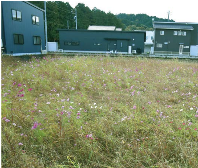
❗ 黒岩地内に咲くコスモス畑