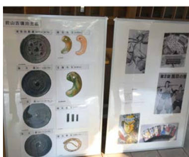
前山古墳跡の出土品