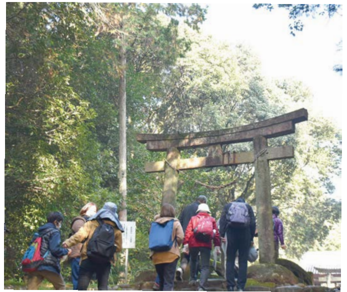
❗ 黒岩神社の鳥居をくぐる参加者