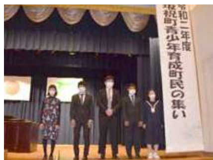
青少年主張の発表者の皆さん