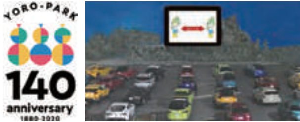
左:養老公園開園140周年 記念ロゴ/右:ドライブインシアター(イメージ)

養老公園開園140周年イベントとして、プロジェクションマッピングや分散型ステージ、ドライブインシアター、オープンカフェなど、withコロナに対応した秋の週末を楽しめる多彩なイベントを実施します。