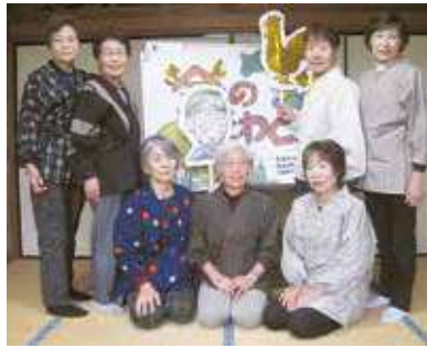
坂祝昔話を伝える会のメンバー