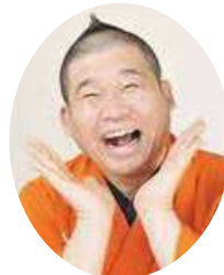
落語家 林家染太氏