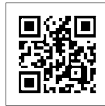
▲ 猿啄城悲話 姫ヶ淵、姥ヶ池