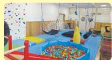
▲つくんこ教室（指導訓練室）