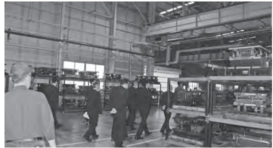
▲(株)金武産業工場内

主に大手自動車メーカーの部品を生産しており、今後も設備投資を行い事業拡大する計画について説明を受けた。