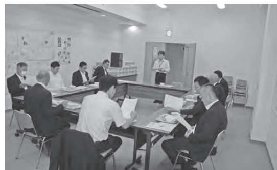
▲坂祝町学校給食センター