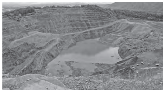
▲(株)小西砕石工業所 採掘現場 ▲

今回は事業拡大を計画している企業、新たな業種に参入した企業など今後の事業展開が期待できる企業を視察することができました。今回視察を行った企業を含め鋭意努力されている町内企業に対して、議会としてできる限りの応援・支援をしていくこととする。