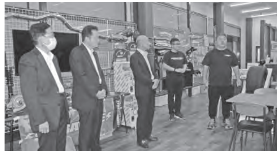
▲柴田自動車(株)事務所

企画課においては、「シバタイヤ」を坂祝町のふるさと納税の品目に加えられるよう検討していただきたい。