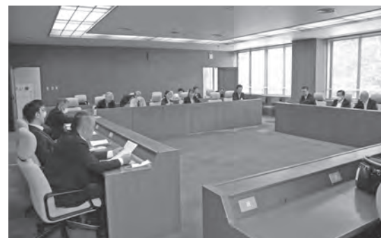
▲教育委員との意見交換

学校給食センターの視察・試食では、食材及び燃料等の物価高騰に苦慮しながらも現場の工夫や町費の負担で対応されている現状が分かった。給食センター開設から20年が経過し、設備全体の老朽化が進んでいることから、近隣市町からも評判の良い坂祝町学校給食の味と質を落とすことのないよう、必要な設備については計画的な更新を図られたい。