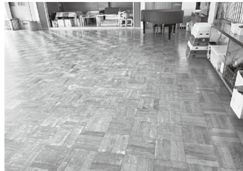
改修予定のこども園遊戯室