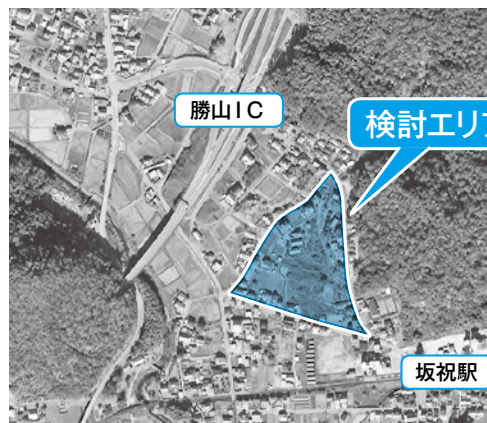
土地区画整理検討エリア