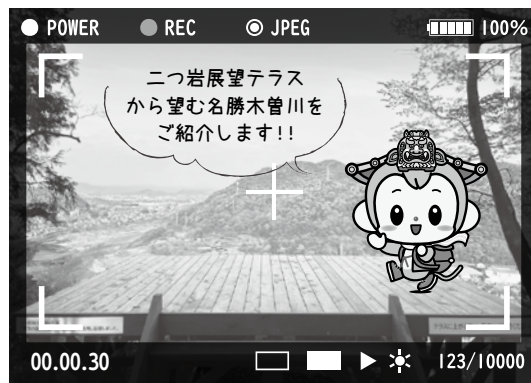
二つ岩展望テラスから望む名勝木曾川

町の魅力を伝えるPR動画を作成し、町ホームページやSNSなどを通じて広く発信します。