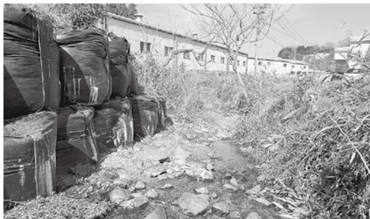
西谷川（2工区）改修測量設計

中小河川の氾濫防止対策として西谷川調整池測量・用地取得、西谷川（2工区）測量設計、大針排水路（1工区）改修詳細設計・用地取得、取組北島地区内水対策工事、黒岩地区姥ヶ池樹木伐採等を実施します。