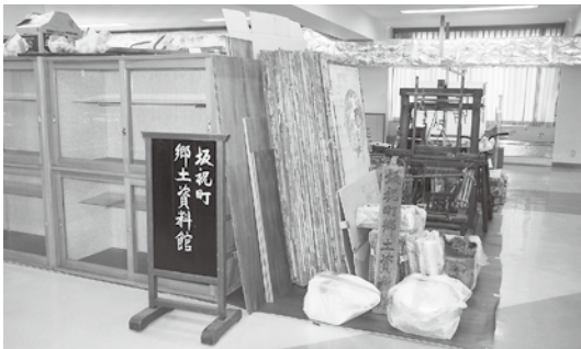
開設準備中の坂祝町郷土資料館

新しい郷土資料館の令和6年度オープンを目指し、小学校体育館1階パーティションの移動、展示コーナーの設置等を行います。