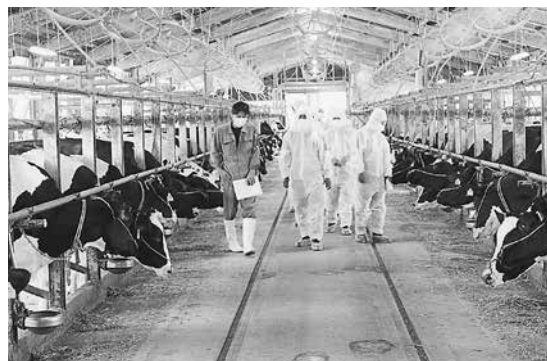
▲白田牧舎株式会社（乳牛牧舎）を視察

②-2 牧草用耕作地の確保に苦慮していることが分かったが、今後増加が見込まれる耕作放棄地をマッチングするなど坂祝町内の耕作地の効率的な有効活用を研究し実践されたい。