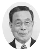
河村 利道 議員