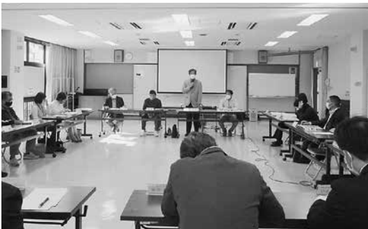
コミュニティ・スクール「園・学校運営協議会」

町民全員がコミュニティ・スクールのメンバーであることを町全体にもっと広めていてもらいたい。