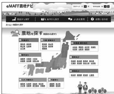
「eMAFF農地ナビ」

「eMAFF農地ナビ」は農林水産省の農地情報の管理に関する検討会や有識者検討会議でも提言されており、取り入れられるものと考えており、期待されます。今後、農林水産省から発せられる追認許可の基準を注視するとともに、引き続き固定資産税部局や建築確認部局等と連携し法制度の周知を図っていく考えです。