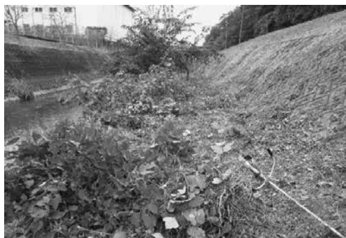
迫間川でのリバーサポーター活動状況

現在一般廃棄物処理許可業者から町内に自社のコンポストセンターを設置できないかと話を受けているところです。町としても実現したい案件ですので、前向きに進めていきたいと思っています。