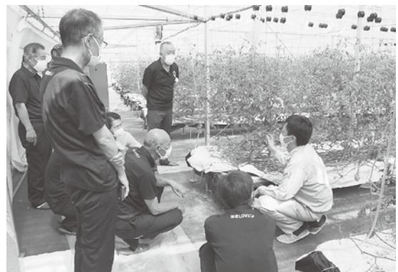
▲シーキューブ株式会社 さかほぎ(トマト)農場を視察