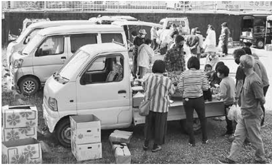
5月8日に開催された「さかほぎ軽トラ朝市」