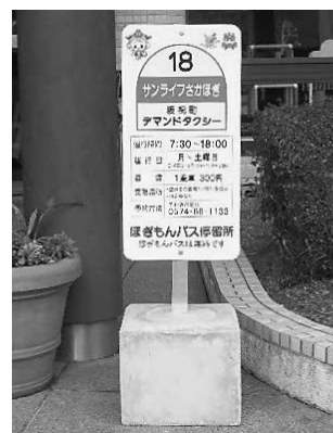
デマンドタクシー停留所 (サンライフさかほぎ)

今後の運用については、2025年に団塊の世代が75歳となり、高齢の方（要介護者や免許返納者）など交通弱者が今まで以上に増え、ご自身での外出に支援が必要となる対象者の増加を鑑みるとニーズを捉えながら利便性の向上に努めるとともに、現に利用していただいている方の負担増にならないような事業転換が可能かどうかも含めて研究してまいります。