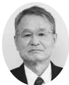
小島 利成 議員

部活動の地域移行計画については、文部科学省や県のロードマップを参考にしながら、地域指導者や中学校等と話し合いながら進めていきたいと考えます。