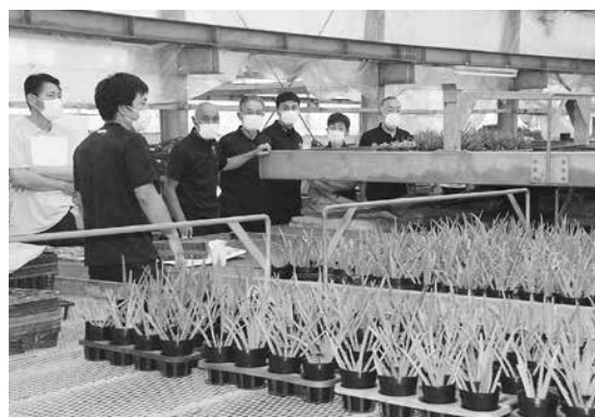
▲オグリ（花卉農園）を視察

③-2 現在は市場向けを中心に出荷してみえるが、個人からのニーズもあるとのことなので、今後は販路の拡大を期待するとともに、行政におかれては「さかほぎ産」を広く発信できるような支援をしていただきたい。