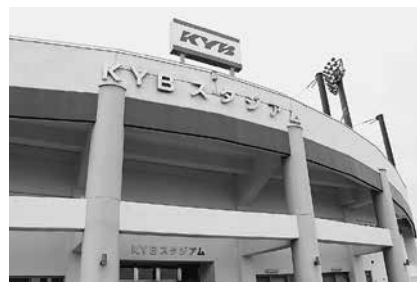
KYBスタジアム（可児市）

今後に関しては、情報収集などを継続していき、導入の必要性などについては施設担当課と財政担当課などで十分な協議を行いながら、導入メリットに大きな可能性が見えた際などには、導入が出来るよう備えていきたいと考えています。