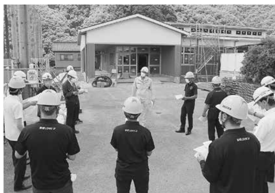
▲子育て支援拠点施設工事現場を視察