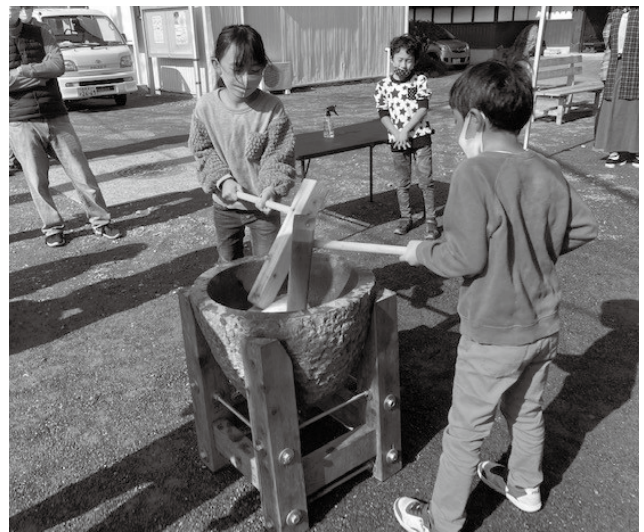
勝山田んぼの楽校の感謝祭