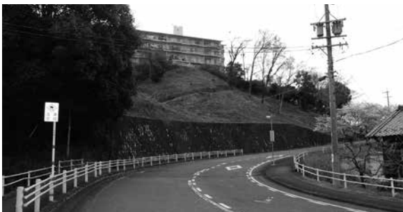
加茂山自治会で管理されている東側斜面

現在のところ町の管理計画はありませんが、当然、町で管理してまいります。あわせて加茂山の2つの自治会と協議を進める中で「これからどうしていくか？」や「散策道をどうしていくか？」などについてご意見を聞き、管理計画も含め方向性を決めて取り組んでいきたい。