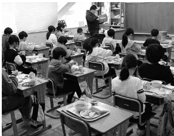
小学校給食時間の様子

食材費は約4,100万円を要し、学校給食費は2年度で3,524万円でした。坂祝町の給食費の現状は小学校が260円、中学校が290円で設定されています。東白川村を除く9市町の平均は小学校が264円、中学校が294円であり、本町の価格設定は妥当であると考えます。「学校給食運営協議会」があり、負担軽減についてもこの組織の中で検討していきます。