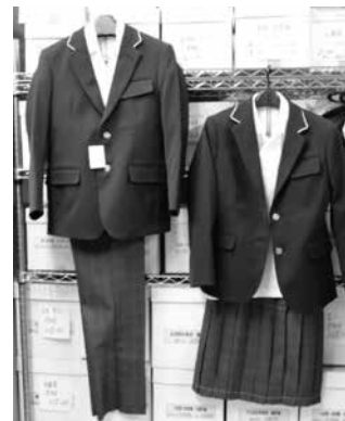
中学校で採用されるブレザー