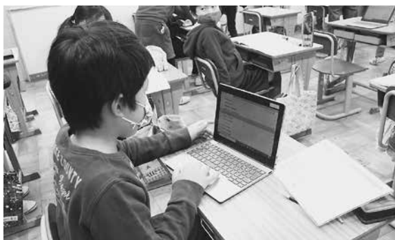
小学校のタブレットを使った授業

今後、端末の落下事故が頻繁に発生するようであれば、落下防止対策をしなくてはなりません。現場の先生や、学校長ともよく相談しながら、時期をみて、購入・設置を検討してまいります。