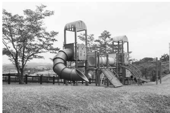
サンライフ南側にある芝生広場と大型遊具

例えばウォーキングが出来るような散策道やドッグランが出来たらPRもしやすいのではないかと思います。色々な方法を考えていきたい。