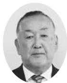
和田 雅彦 議員

進員)を選抜し、この先生が中心となり学年・教科等各レベルに応じた勉強会を開催しました。夏休み期間には、ICT研修講座にも参加予定です。