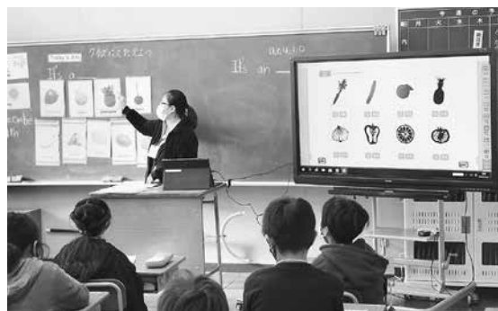
デジタル教材を使った小学校授業

昨年度、GIGAスクール構想における「一人一台端末」が予定より早く整備できました。ハードを整備しても、それを活用する小中学校の児童生徒はもちろんのこと、指導にあたる教員らが、必要な知識・技術を習得することは必須です。導入時にタブレット端末の基本操作の方法やデジタルドリルなどのアプリの使い方の研修を行いました。現在も導入先の技術員から端末を活用した授業のやり方などをサポートしてもらい、先生方も安心して取り組んでいます。