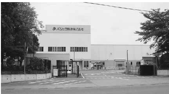
長らく地域を支え続けたパジェロ製造株式会社本社