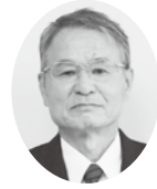
小島 利成 議員