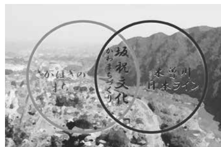
坂祝町かわまちづくり基本計画より

当町のかわまちづくりで取り組む内容としては、基本計画では4つの分類をしています。1つめの「体験・アクティビティ」では、河川空間を体験し、さらなる活用を促進するためのアウトドアやイベント、親水体験のできる空間整備を掲げています。2つめの「景観・自然環境」では、景観や自然環境を維持し、より魅力的にするために奇岩や隕石跡、自然景観をめぐる周遊ルートや散策道の整備を掲げています。3つめの「歴史・教育」では、河川にまつわる歴史的資源を活用、発信し、次世代へとつなげるために中山道や城山登山道との連携や勝山湊、大まや湊の再整備などを掲げています。4つめの「まちづくり・日常生活」では、まちの活性化や賑わい創出のための駐車場やトイレ、拠点の整備、各種イベントの開催を掲げています。総じてハード・ソフト両面から賑わいのある空間を創っていくものです。