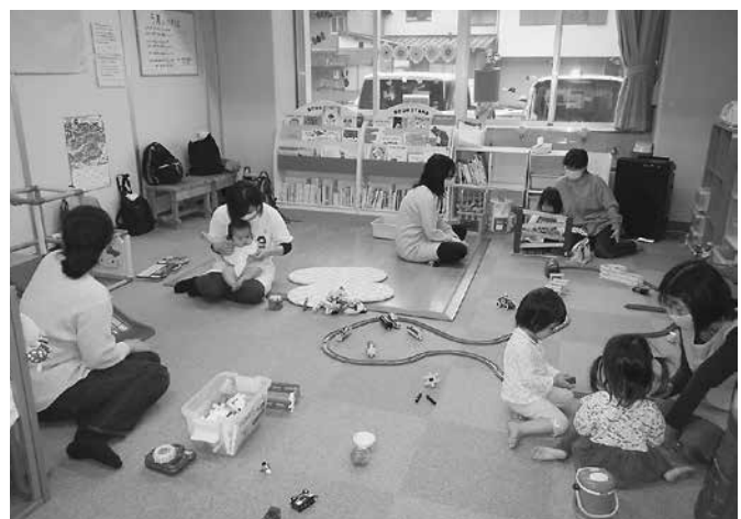
小学校体育館1階に仮移設した「つくんこ教室・アンブレラ」を視察