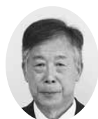
松田 賢治 議員