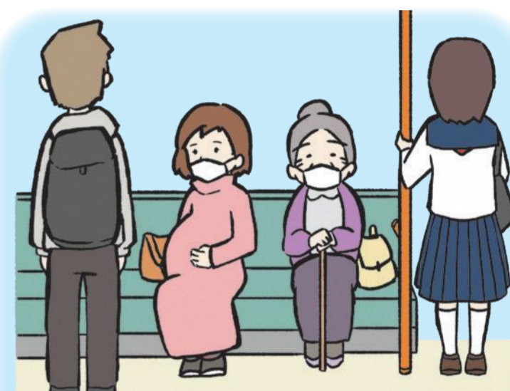
前往高重症化风险人士聚集的场所时