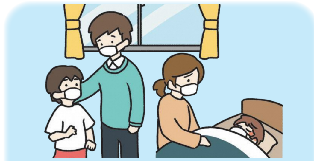
出现阳性反应，同居亲人有阳性者的时候