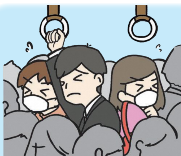
乘坐高峰时期的电车和公交车时