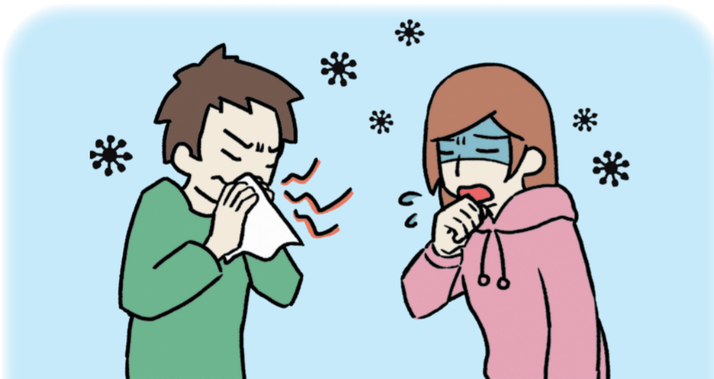
出现流鼻涕，咳嗽等症状的时候