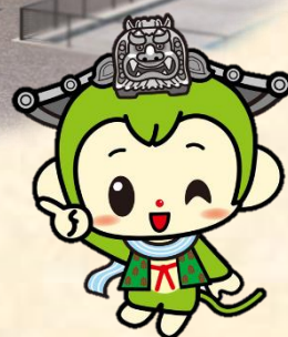
坂祝町マスコットキャラクター 「ほぎもん」

坂祝町が取り組む 「魅力にあふれ 住み心地のよい」 まちづくりをご支援ください。